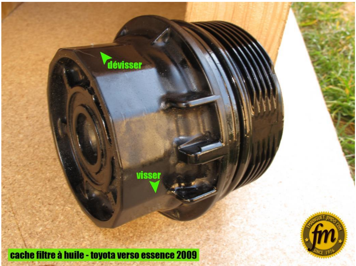
cache filtre à huile - toyota verso essence 2009