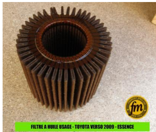
FILTRE A HUILE USAGE - TOYOTA VERSO 2009 - ESSENCE