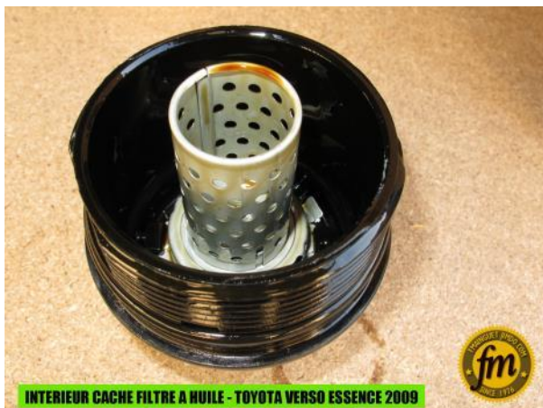
INTERIEUR CACHE FILTRE A HUILE - TOYOTA VERSO ESSENCE 2009