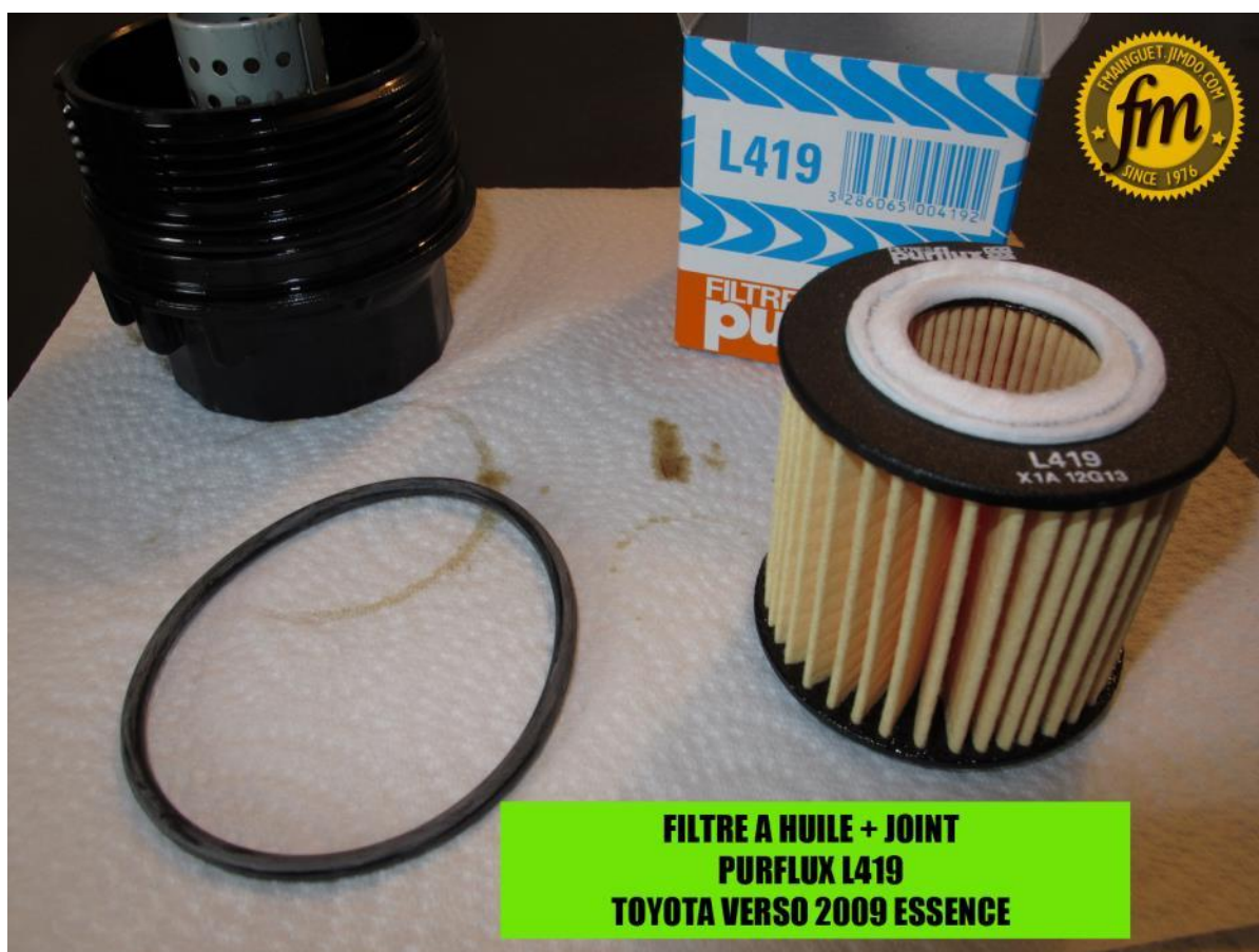
filtre à huile purflux L419